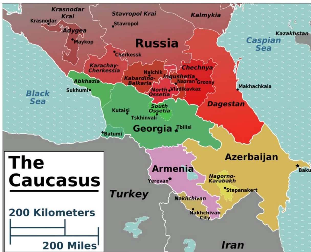
Politická mapa Kavkazského regionu. 38