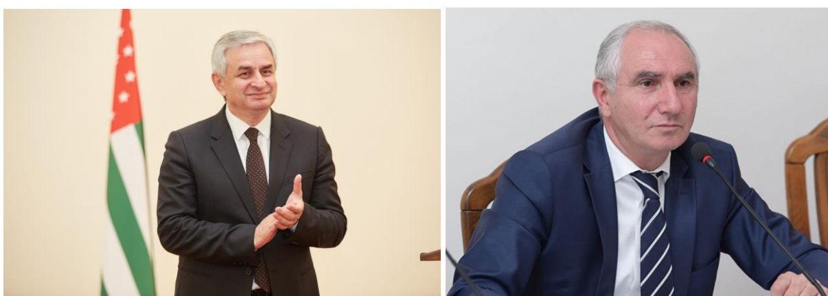
Prezident Abcházie Raul Džumkovič Chadžimba (vlevo) a premiér Abcházie Valerij Ramšuchovič Bganba (vpravo). 35