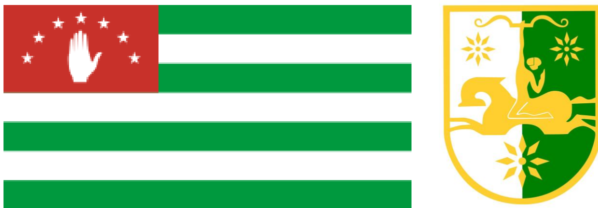
Vlajka a státní znak Abcházie. 34