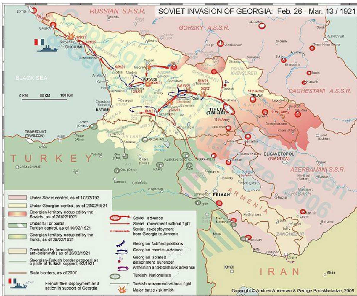
Mapa zobrazující invazi sovětských vojsk na území Gruzie v únoru – březnu 1921. 36