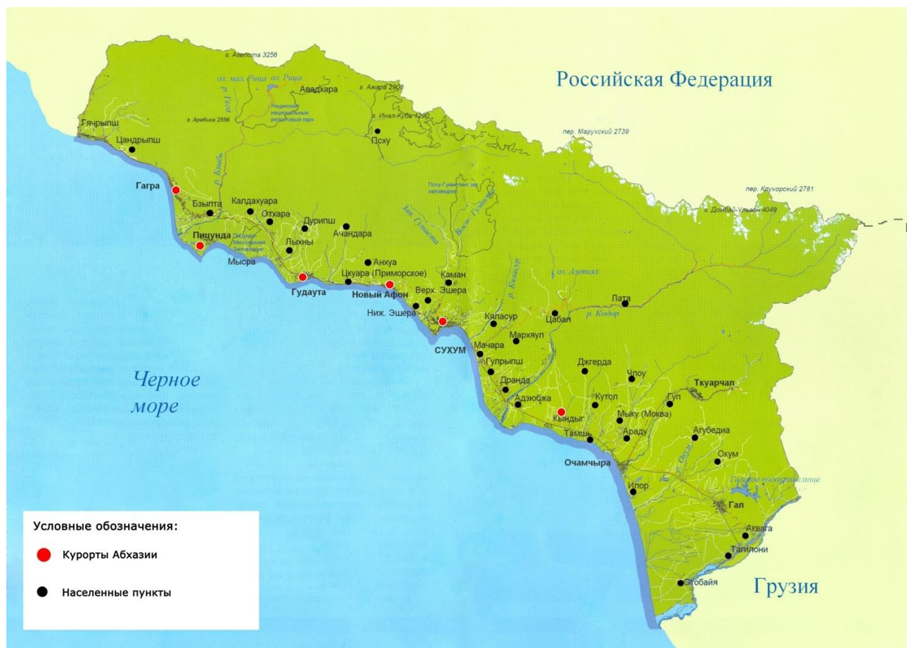
Obydlená sídla Abcházie. 41