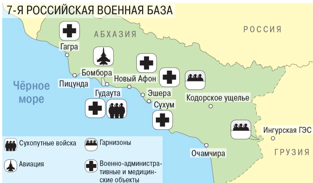
Mapa rozmístění 7. ruské vojenské základny v Abcházii. 43