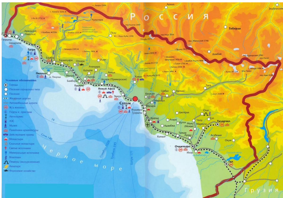
Mapa reliéfu Abcházie se zřetelnou hornatou částí území. 39